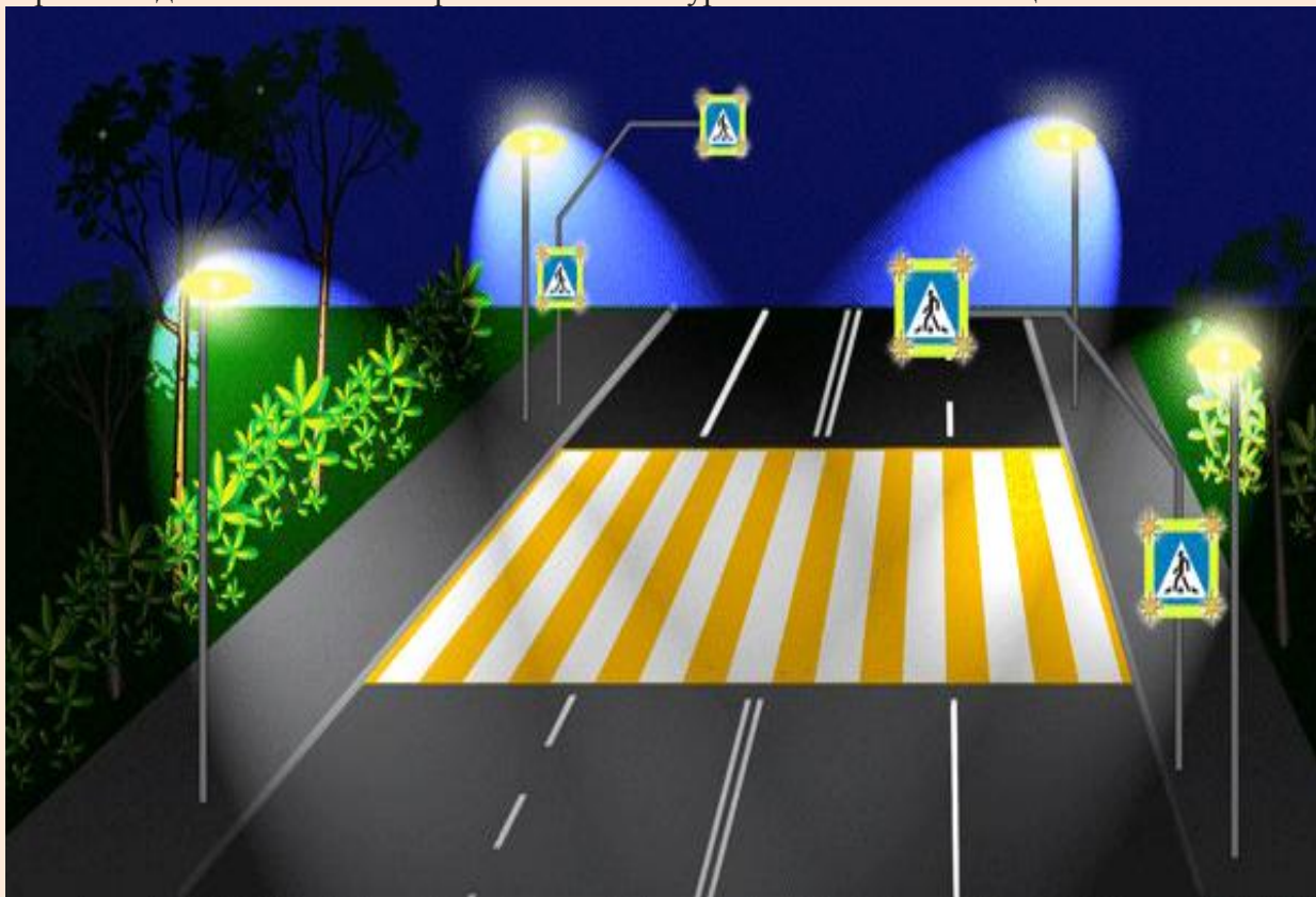
Предлагаемый вариант улучшения распознаваемости места перехода: освещение всех пешеходных переходов, использование разноцветной разметки, использование знаков на

Тем не менее, проведенный анализ показал, что действующие нормативы, предъявляющие требования к безопасному размещению и обустройству пешеходных переходов, не соответствуют современным условиям. В связи с этим Госавтоинспекцией разрабатываются предложения по реализации новых стандартов, положительно зарекомендовавших себя в странах с высоким уровнем автомобилизации.